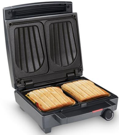
Sandwich Maker SW 1451