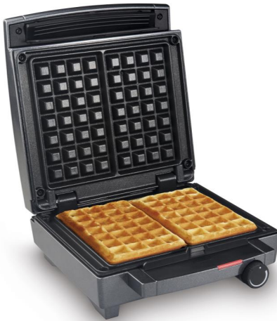
Waffle Maker WA 1451