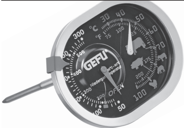
Braten- und Ofenthermometer 3 in 1 MESSIMO Roast and Oven Thermometer 3 in 1 MESSIMO Art-Nr.: 21800